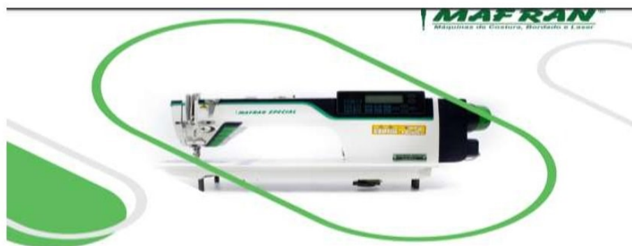
MANUAL RETA ELETRÔNICA MS-D9-4

Na sequência, a figura do print da página onde mostra o manual apresentado. Lembrando que todos os documentos estão anexados na plataforma eletrônica BLL, sendo possível comprovar a veracidade de todas essas informações aqui relacionadas.